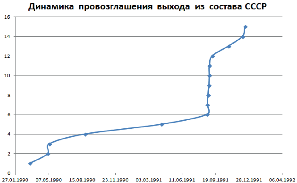
Рис. 3. График провозглашения выхода союзных республик из СССР. 1 — Литва, 2 — Латвия, 3 — Эстония, 4 — Армения, 5 — Грузия, 6 — Украина, 7 — Беларусь, 8 — Молдова, 9 — Азербайджан, 10 — Узбекистан, 11 — Кыргызстан, 12 — Таджикистан, 13 — Туркменистан, 14 — РСФСР, 15 — Казахстан

требления, введением в ряде районов и областей страны карточно-талонной системы на приобретение отдельных товаров и продуктов.