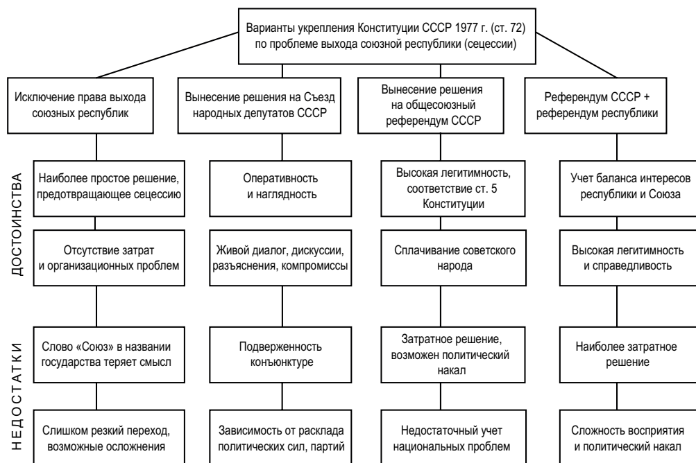
Рис. 2. Варианты укрепления Конституции СССР по проблеме сецессии

республики от Союза. Реализация принятого изменения, конечно, требовала большей слаженности и эффективности работы союзного чиновничьего аппарата. В свою очередь, именно это могло консолидировать его на позитивных принципах сохранения СССР, препятствуя тем самым негативным тенденциям, которые в недалеком будущем привели к выступлению ГКЧП.