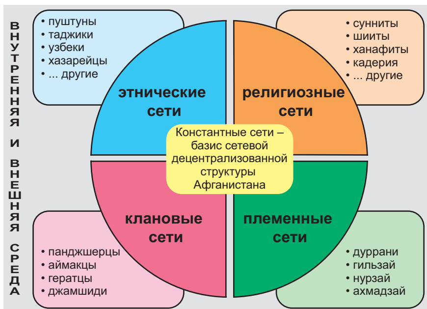
Рисунок 1. Постоянные сетевые структуры, сохраняющиеся в различных политических системах на протяжении исторических эпох афганского общества [4]

система, в которой переплетаются многочисленные местные и международные сети социального, политического, экономического, религиозного, террористического, информационного характера. Подобные сети выступают как доказательство трансграничности, простираясь за пределы страны и образуя узлы в других государствах. В данном контексте здесь понимаются группы, объединенные общими интересами и взаимодействующие на основе неформальных, самостоятельно определяемых связей.