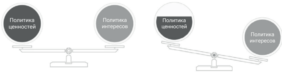
Рисунок 1. « Политика ценностей » и « политика интересов » в российской политике ФРГ в 2005–2008 и 2008–2011 гг. соответственно

всего внимание уделяется совместной борьбе с негативными последствиями кризиса, при государственном содействии подписываются многомиллиардные соглашения. Показательны темпы послекризисного восстановления двусторонних экономических отношений: если в 2008–2009 гг. объемы двусторонней торговли упали до 45,8 млрд евро, то в последующие два года они увеличились более чем в полтора раза, превысив докризисные показатели на 8,5%. [7]. В конце концов, в 2011 г. был введен в эксплуатацию трубопровод «Северный поток-1». Как итог, в 2008–2011 г. «политика интересов» начинает преобладать в российской политике ФРГ. События в Южной Осетии 2008 г. воспринимались германским руководством — пусть и негативно — как «единичный случай» [3, с. 308] и не повлекли за собой какого-либо сокращения сотрудничества двух стран.