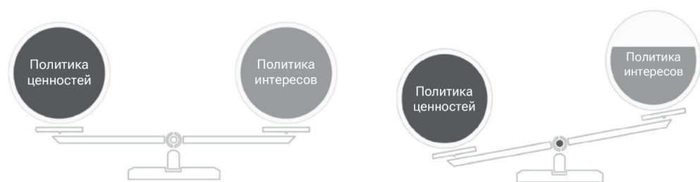
Рисунок 2. «Политика ценностей» и «политика интересов» в российской политике ФРГ в 2012 — начале 2014 и в 2014–2015 гг. соответственно (кризисный подпериод)

работа ряда двусторонних площадок. В то же время ФРГ не отказывалась от экономического сотрудничества, и в 2012–2013 гг. объемы двусторонней торговли достигли рекордных значений — более 77 млрд евро [7].