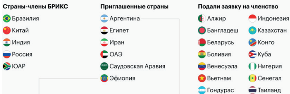
Рис. 2. Карта расширения БРИКС

БРИКС — блок развивающихся стран, сформированный в 2010 году. В 2024 году к блоку присоединится еще 6 стран