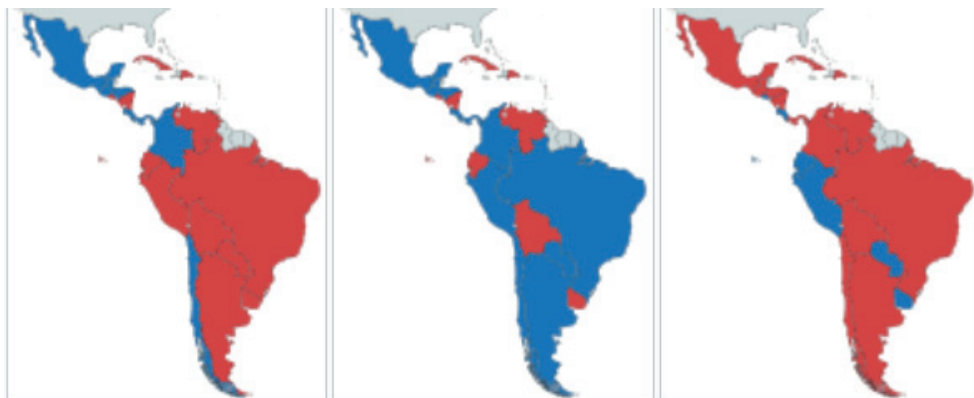
Рис. 1. «Розовый прилив» 2011 (слева), 2019 (центр), 2023 (справа)

взаимодействия с неамериканскими государствами [7].