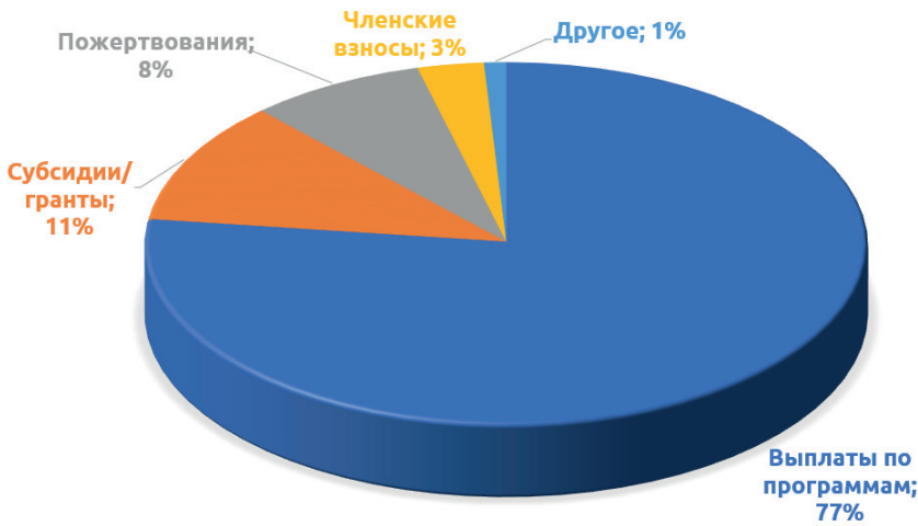
Рис. 1. Структура доходов НКО, образованных после 1998 года