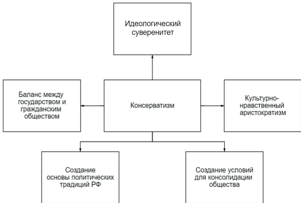
Рисунок 2. Преимущества консерватизма в политическом управлении

консерватизма. Любая политическая традиция сначала опиралась на договор, который в дальнейшем так или иначе изменился (или вовсе отрицался). Получается противоречие, поскольку, с одной стороны, консерваторы отстаивают «вечные и неизменные» этические основания общества, а с другой — любые политические традиции учреждались в истории развития государства. Снятием противоречия являются действия политических акторов, направленные на создание политических традиций, в наилучшей степени отражающих этические основания общества (за этот подход могут выступать умеренные консерваторы). Поэтому американские отцы-основатели были успешны в своих конвенциях. Безусловно, политические традиции могут быть абсолютно гетерогенны этическим основаниям, присутствующим в обществе, что естественно порождает их неприятие в социуме. Умеренные консерваторы выступают за то, чтобы реформы в обществе проводились