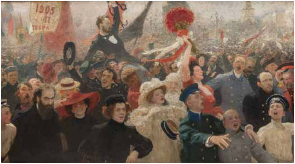
Репин И.Е. 17 октября 1905 года. Холст, масло. 184 x 323.