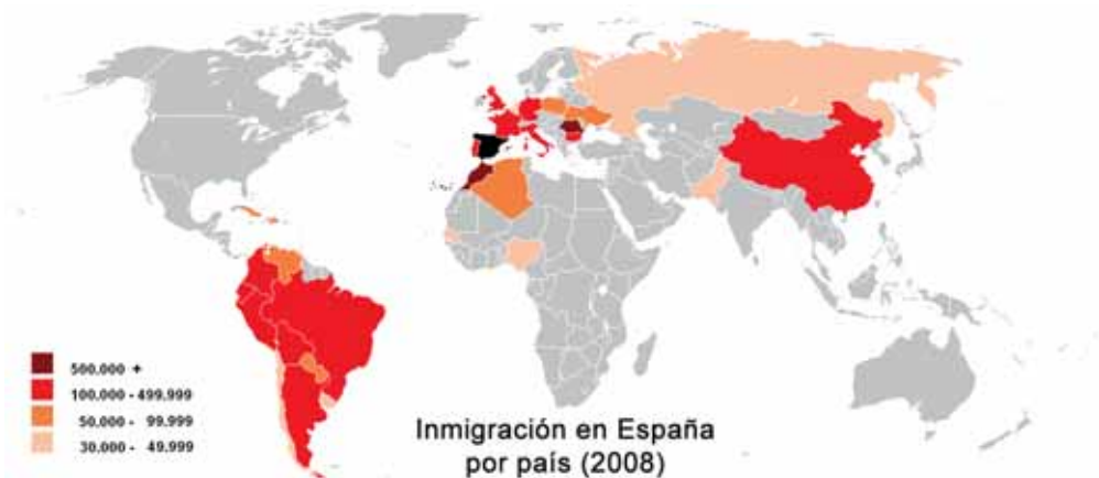
Рисунок 1. Миграционные потоки по состоянию на 2008 год

Наиболее обильный приток иммигрантов в Испанию отмечается в 2015 году [6]. Массово иммигранты, беженцы стали прибывать с территории Ближнего Востока [1]. Большая часть бежала из Сирии в связи с гражданской войной в государстве. В том же году Европейский союз принял большое количество запросов от иммигрантов