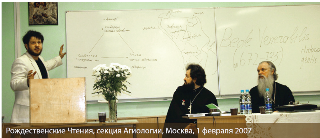
Рождественские Чтения, секция Агиологии, Москва, 1 февраля 2007

О каком исламизме шиптаров может идти речь, если их флаг с двуглавым орлом (который сами шиптары называют Орлом Скандербеге) недвусмысленно напоминает о том, что Албания вышла из Византийского мира. А в глазах всего мира наиболее выдающиеся албанцы — это собственно Скандербег (насиленно обращенный в ислам, но вернувшийся в христианство тотчас же после антитурецкого восстания), католическая святая мать Тереза и европейски воспитанный диссидент Ибрагим Ругова. (Слухи о том, что он был крещен в Католической церкви, не подтверждаются: церемония похорон Руговы была совершена по канонам ислама, и тем не менее этого албанского лидера очень трудно позиционировать в качестве политического лидера мусульман, поскольку стажировавшийся