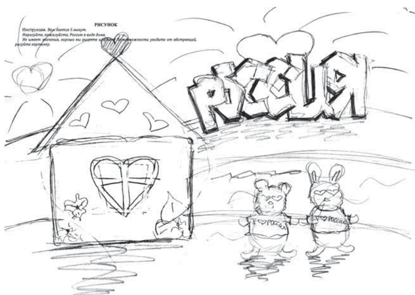
Рисунок 1. Отношение к России-стране

Во-вторых, положительные эмоции российских старшеклассников обращены к России-стране: в рисунках это проявляется в изображениях природно-ге-