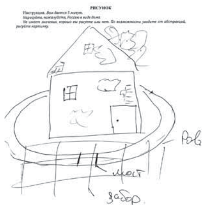
Рисунок 3. Отношение к внешней политике