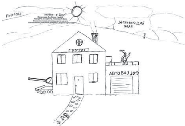
Рисунок 4. Отношение к внешней политике