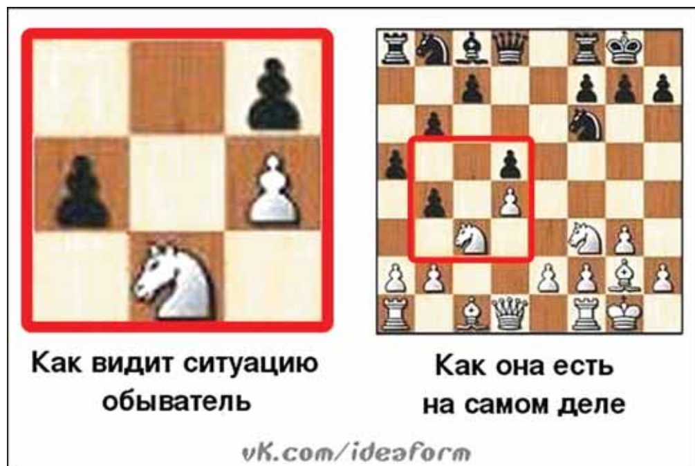
Рисунок 2. Приблизительно так. Конечно, автор трансфера, а не обыватель. Хотя обе стороны неправы — таких ситуаций не бывает

этот инструмент отвлечения внимания от того, что они реально делали, еще более циничный: «Хлеба, бабу, зрелищ».