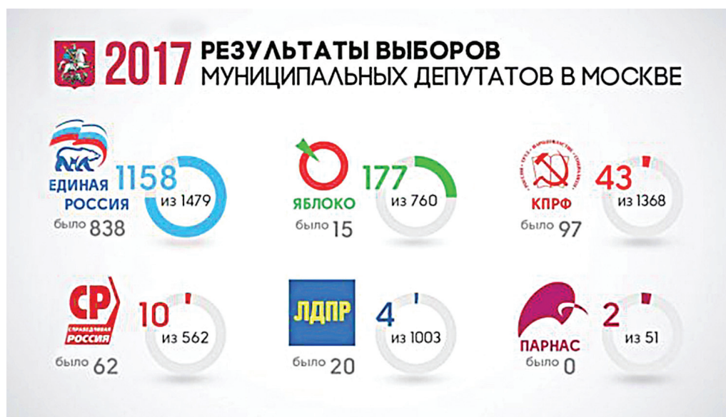
Рисунок 1. Результаты выборов в Москве в 2017 г.

21 ноября 2017 г. ЦИК России и Российский фонд свободных выборов провели в Москве общероссийскую конференцию «Наблюдение на выборах в Российской Федерации», посвященную вопросам организации общественного наблюдения на выборах президента РФ в марте 2018 г. На конференции председатель ЦИК России Э. Памфилова и секретарь Общественной Палаты России В. Фадеев подписали соглашение о взаимодействии. Результатом этого соглашения стало создание Корпуса наблюдателей от Общественной палаты. В частности, только в Москве был сформирован блок наблюдателей порядка 3,5 тыс. человек из разных областей и сфер трудовой деятельности.