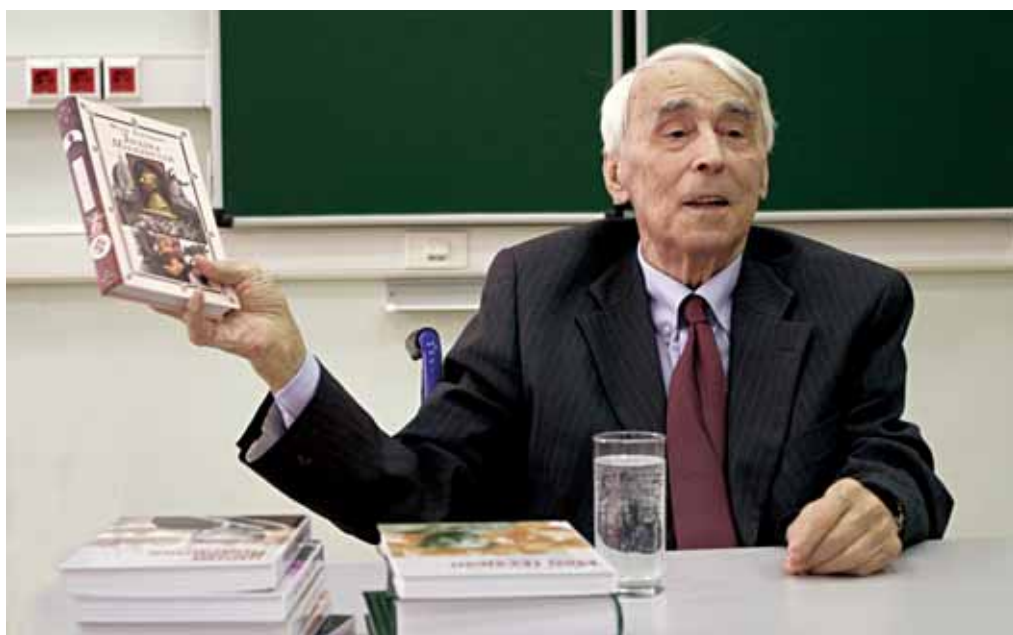
Встреча Ф.М. Бурлацкого с сотрудниками факультета политологии МГУ имени М.В. Ломоносова (8 июня 2011 г.)

политики, которая включает в себя исследование проблем войны и мира, мирного сосуществования, международных конфликтов, международного взаимодействия, международных решений, процесса интеграции интернационализации, развития международных коммуникаций, взаимосвязи внешней политики государств и идеологии и др.; 4) теорию социально-политического управления, которая включает в себя исследование форм и методов, субъекта и объекта управления, принятие решений, организацию их исполнения, контроль и т.д. [3].