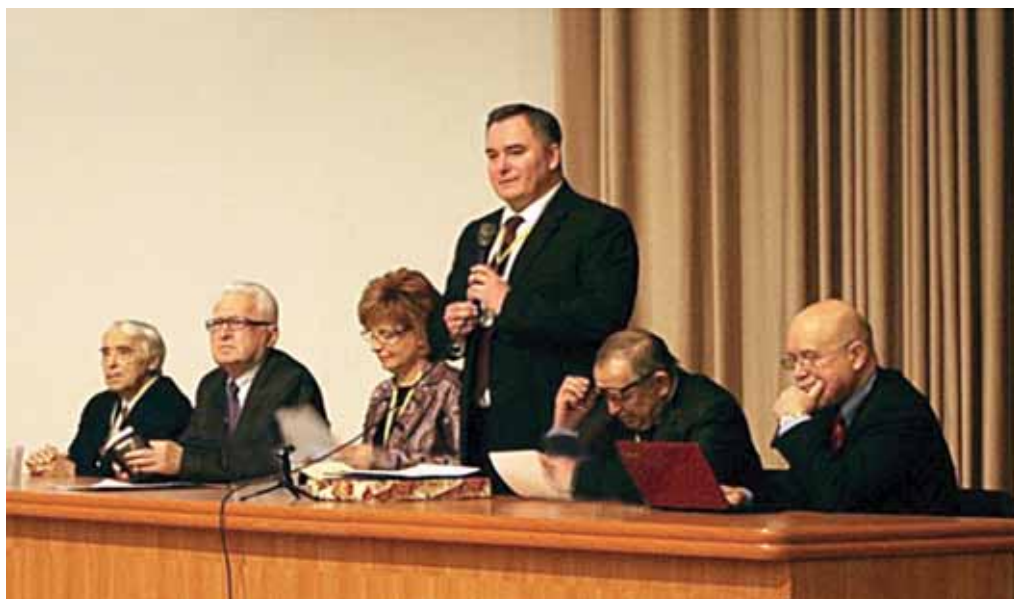
Президиум Всероссийского научно-образовательного форума «Политология — XXI век». Москва, МГУ, 2011 г.

пропаганды и т.д. Нельзя сказать, что эти проблемы сегодня совсем не изучаются. Они изучаются, но преимущественно в рамках исторической науки либо правовой, а многие проблемы остаются вне поля зрения ученых.