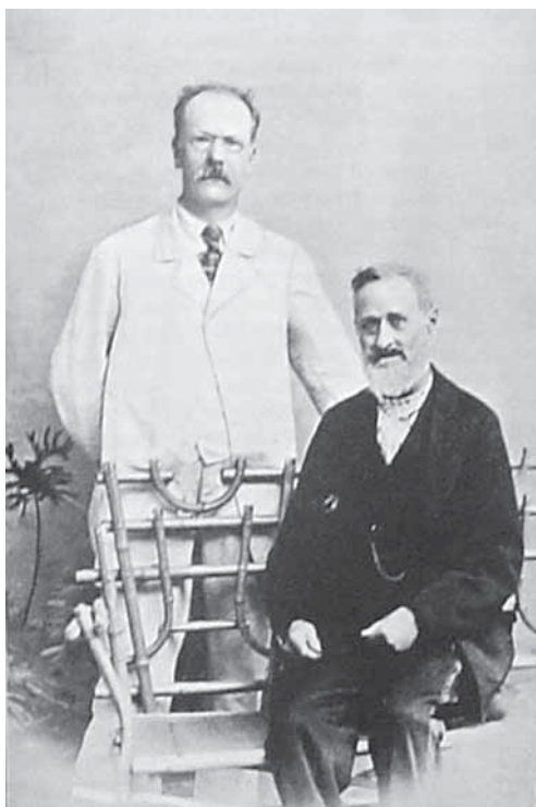
Будилович и Добрянский

туда русского элемента также не выполняема. Миграционные потоки всегда идут «из стран более населенных в менее населенные» [4. — С. 42], поэтому говорить о колонизации Польши также смешно, как говорить о том, что «Швеция может колонизовать Англию» [4. — С. 42]. В-третьих, любые призывы к насильственной колонизации края, по мнению Будиловича, идут от тех, кто желает отдать Польшу немцам. «Лучше даже потерять Польшу, чем насильственно ее обрусить», — заявляет он. Применение силы приведет лишь к тому, что Россия оттолкнет от себя другие славянские народы, чем приготовит «великое торжество для немцев, которые не замедлят эксплуатировать в свою пользу негодование на Россию славянских народов» [4. — С. 42].