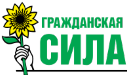
Всероссийская политическая партия «Гражданская Сила». Партия позициони-

Всероссийская политическая партия «Партия Роста». Формально «Партия Роста» является преемницей партии «Правое дело», подвергнувшейся ребрендингу. В своих программных положениях партия поддерживает внешнюю политику Президента РФ и критикует работу социально-экономического блока Правительства РФ, что, в целом, соответствует характерному для данного промежутка времени мейнстриму, и в этом отношении становится в один ряд с большинством партий — участниц избирательной кампании 2016 г. Политический потенциал партии на данный момент стабильно низок, с точки зрения электорального потенциала партия является аутсайдером. Идеологическая ниша «Партии Роста» представляет собой симбиоз либерализма и консерватизма, что позволяет нам поместить ее в соответствующий промежуточный сегмент оси партийного спектра.