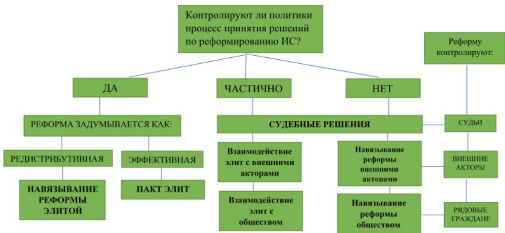
Рисунок 2. Типы электоральных реформ (адаптировано по Renwick 2010: 11)

Рисунок 2 помогает наглядно проследить за рассуждениями автора. Проведение ЭР по инициативе полностью контролирующей процесс принятия решений политической группы ставит ее перед выбором одного из типов реформы: редистрибутивная (улучшающая положение одной группы общества за счет другой) или эффективная (при сохранении status quo улучшающая условия для всех или