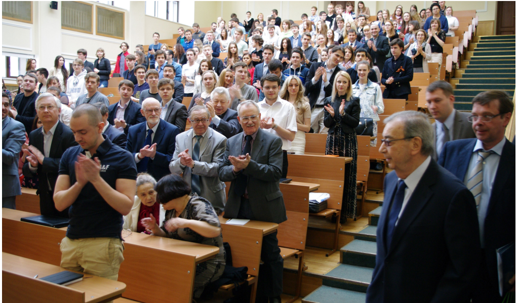
Е. М. Примаков на факультете политологии в МГУ имени М. В. Ломоносова. Апрель 2014 г.

Такая доктрина поддерживалась следующими аргументами: