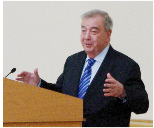
Е. М. Примаков на лекции на факультете политологии в МГУ имени М. В. Ломоносова. Апрель 2011 г.