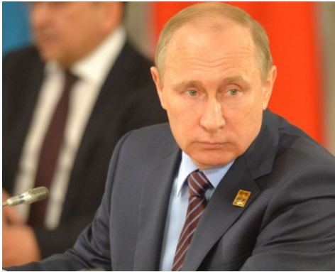
Президент России Владимир Владимирович Путин:

— Современный мир действительно многополярен, сложен и динамичен, это объективная реальность. И попытки построить модель международных отношений, в которой бы все решения принимались в рамках единственного полюса, неэффективны, то и дело дают сбой и в конечном счете обречены на неудачу 1 .