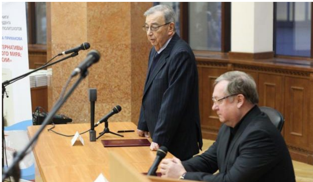
Выступление Е. М. Примакова на конференции Российского общества политологов «Трансформация роли государства в современном мире» в МГУ. В рамках конференции состоялась презентация книги Е. М. Примакова «Вызовы и альтернативы многополярного мира: роль России». На фотографии: Е. М. Примаков (слева) и С. В. Степанов (справа). Декабрь 2014 г.

Примаков считал, что два аргумента, которыми обосновывается доктрина американского унилатерализма, несостоятельны и приводил мнения американских политиков, которые отрицали доктрину однополярного миропорядка. Среди таких политиков можно выделить бывшего посла в Москве Джека Мэтлока 1 , а также уважаемого политика Джорджа Кеннана 2 .